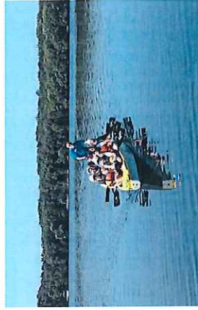
Edizione 2014/2015 residenziale a Sabaudia, FFGG

Se tu guardassi, seduto in mezzo agli spettatori, le prodezze di quegli uomini, la bellezza dei corpi, la robustezza mirabile, le prove straordinarie, la forza imbattibile, il coraggio, l'emozione, lo spirito indomabile, l'impegno insuperabile profuso per la vittoria, non cesseresti di lodare, di acclamare, di applaudire. (Luciano, Il secolo d.C.)