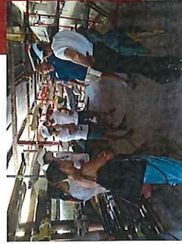
Edizione 2014/2015 residenziale a Sabaudia, FFGG

Tel.: 06.83.76.20.11 Posta elettronica: formazione@studiohfc.com